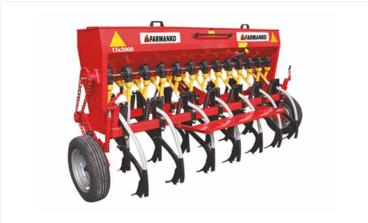
Cereals Seeder Machines