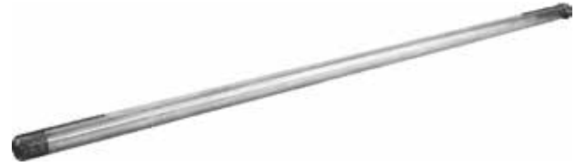
Drummed Mower Gear Box Shafts

عامود مؤخرة ماكينة جز الحشائش الاسطواناني