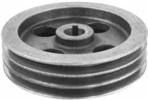
Drummed Mower Big Pulley

ماكينة جز الحشائش الاسطوانى صغيرة ذات بكرات