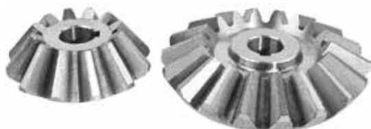
Special Cone Gear