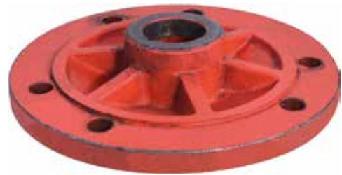
Drummed Mower Hub

ماكينة جز الحشائش الاسطوانى كبيرة ذات بكرات