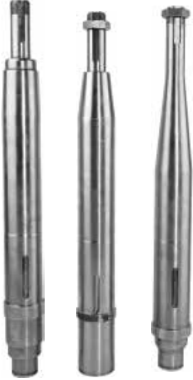
Drummed Mower Stern Shafts