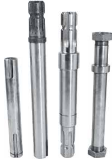
Drummed Mower Pulley Shafts