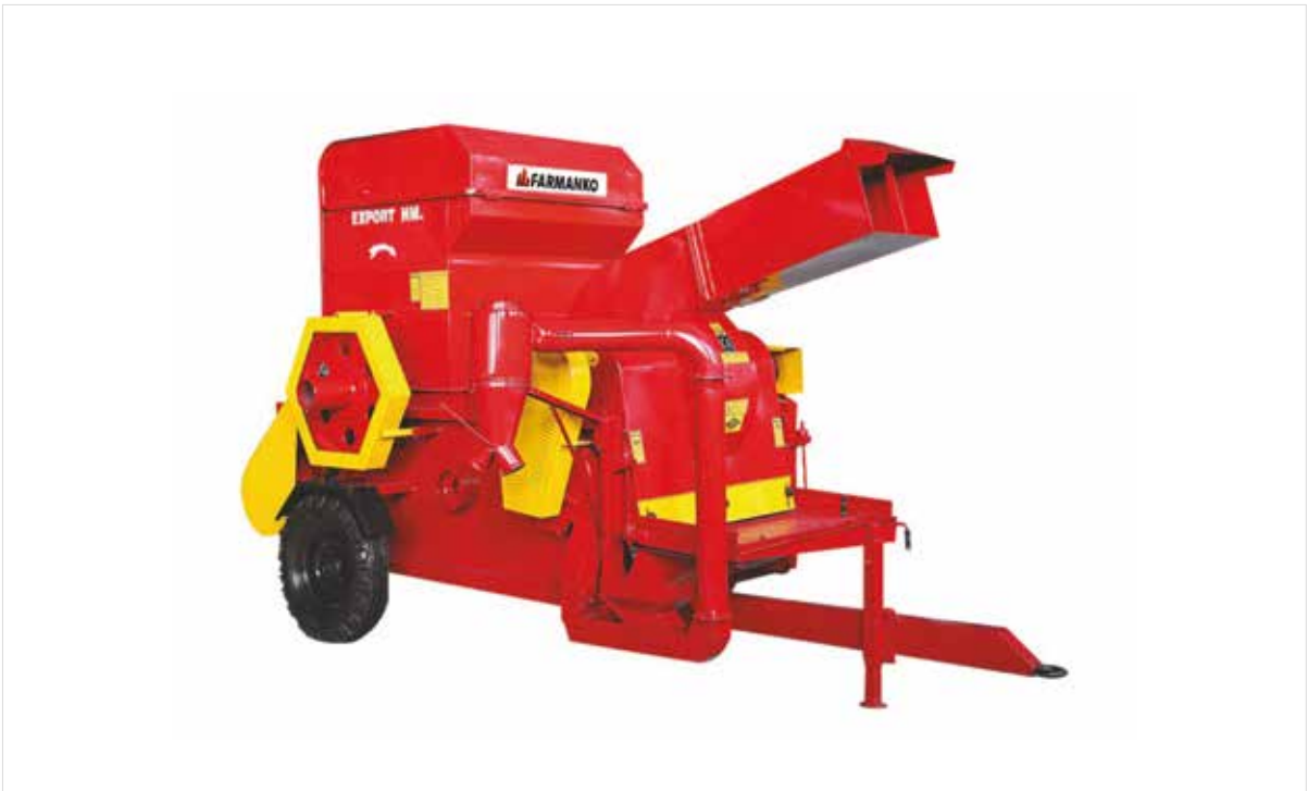
Harvester Tresher Machinery