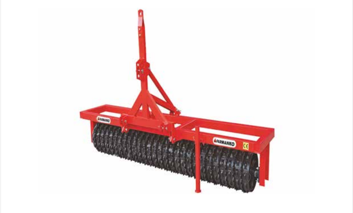
Casting Field Cultivator