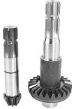
Baling Loader Transmission Gear

ترس لماكينه جز الحشائش ذو خاصية الاسطوانة