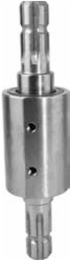
Splined Intermediate Bearing