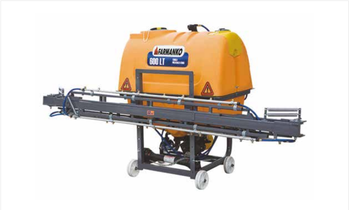
Tractor Mounted Sprayer