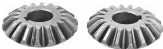
Fertilizer Spreader Transmission Gear 1/1

Шестерня коробки передач разбрасывателя удобрений 1/1