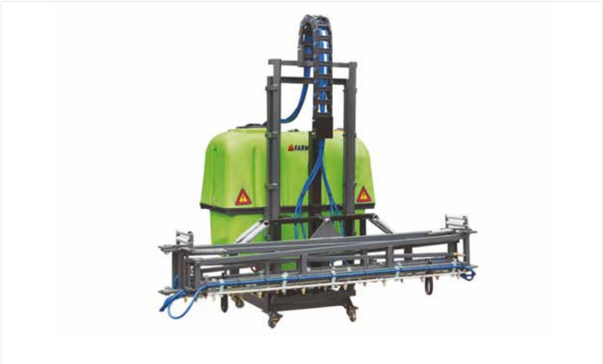
Hydraulic Lifted Field Sprayer