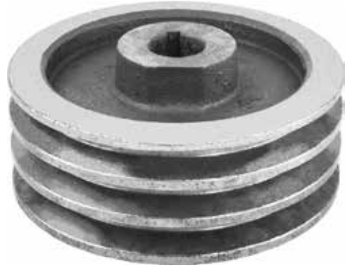
Drummed Mower Small Pulley