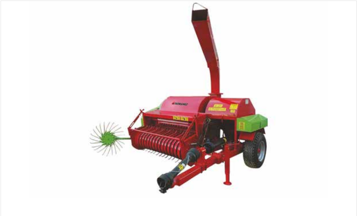
Automatic Stem Collecting Straw Machine