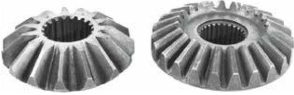
Drummed Mower Gear