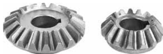
Fertilizer Spreader Transmission Gear 1/33

Шестерня коробки передач разбрасывателя удобрений 1/33