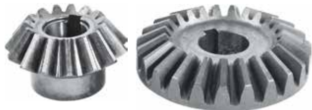
Drummed Mower Cone Gear