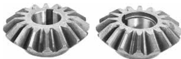
Special Cone Gear