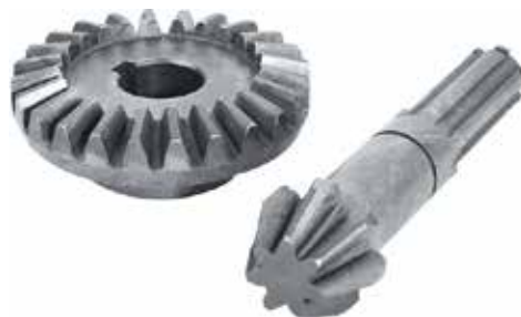
Fertilized Intermediate Anchor Transmission Gear

ترس مخروطي لماكينة جز الحشائش ذو خاصية الاسطوانة