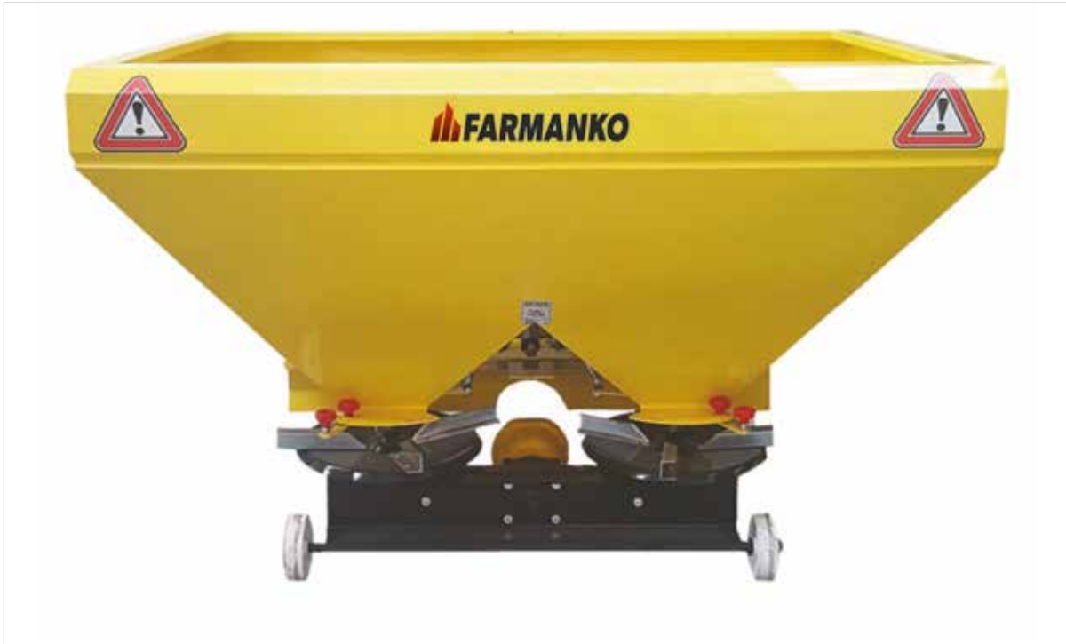
Fertilizer Spreading Machine